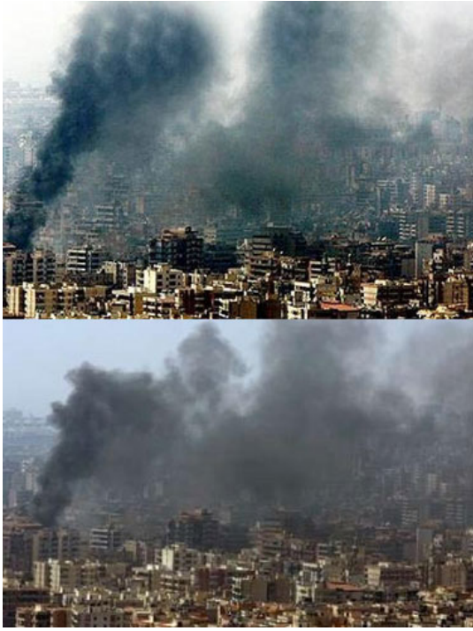
Abbildung 1: Manipulation eines Bildes aus dem Libanon-Krieg.

Zeit sind durch den Fall des südkoreanischen Klonforschers Hwang Woo-Suk auch Bildfälschungen in wissenschaftlichen Veröffentlichungen verstärkt in das öffentliche Blickfeld geraten. Nachdem bekannt geworden war, dass es sich bei dessen Publikation im Magazin Science zu Fortschritten in der Stammzellenforschung um eine Fälschung handelte, trat der angesehene Professor von allen Ämtern zurück. Die gefälschten Ergebnisse wurden dabei maßgeblich durch manipulierte Abbildungen unterstützt. Dass es sich auch in diesem Bereich bei Bildmanipulationen nicht um Ausnahmen handelt, zeigt, dass Schätzungen zufolge bei einem Fünftel aller akzeptierten Artikel des Journal of Cell Biology Abbildungen aufgrund von unzulässigen Manipulationen nachgefordert werden müssen [5].