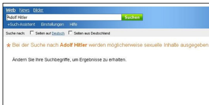
MSN Search Beta – Suchbegriff: „Adolf Hitler“

Wenn Freiheit überhaupt etwas bedeutet, dann vor allem das Recht, anderen Leuten das zu sagen, was sie nicht hören wollen. (George Orwell)