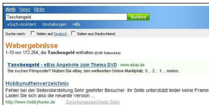
MSN Search Beta – Suchbegriff: „Taschengeld“

Diese Selbstzensur und Bevormündung der Bürger zeigt sich aktuell sehr deutlich in der im Betatest befindlichen MSN Search von Microsoft 8 , die sich bei sexuellen, anstößigen oder anderweitig zensurbedürftigen Suchbegriffen einerseits sehr bedeckt verhält, andererseits direkt auf Geschäftspartner von MSN verlinkt. Microsoft begründet diese Zensur mit dem deutschen Jugendmedienschutz-Staatsvertrag, der am 1. April letzten